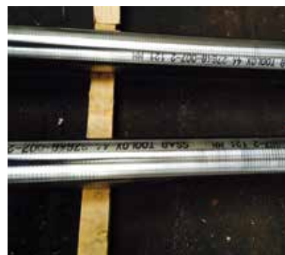
Toolox bar id.

Toolox está en el mercado desde 2002 en chapa gruesa. Se trata de un producto extensamente probado, tanto para moldes y matrices como para componentes de máquinas.