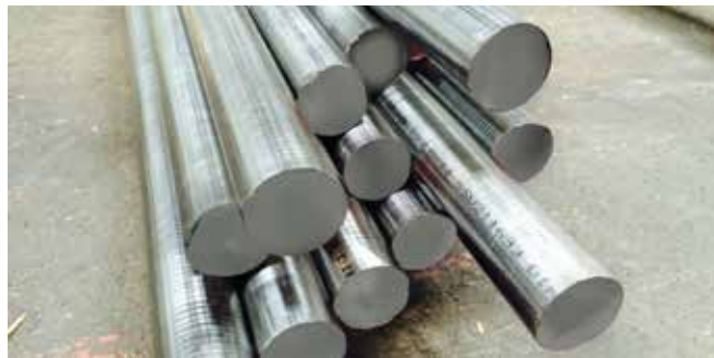
609-es-Toolox: Toolox in round bars V1-2015 Höllede

Debido a su altísima pureza, la superficie del producto final, más que el propio acero, es el factor crítico para definir las propiedades de resistencia a la fatiga. En aplicaciones donde es necesario una mayor dureza superficial más elevada para resistir desgaste, Toolox puede ser nitrurado o recubierto con PVD. Además, se puede utilizar Toolox en aplicaciones que trabajan a temperaturas elevadas, hasta los 590°C.