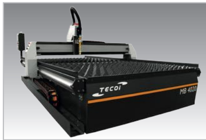
Model 4020 Modelo 4020