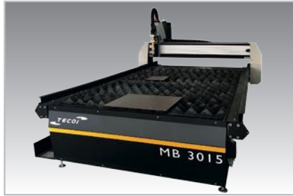
Model 3015 Modelo 3015

Without a doubt, the MB model is the perfect solution for low and average production lines. With this model, TECOI is strengthening its leadership in the manufacture of cutting machines with the best performance on the market.