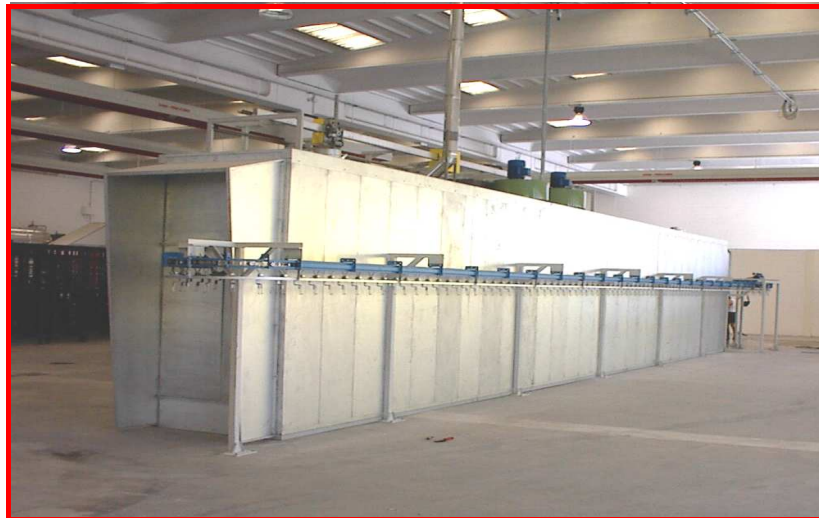
Versión en continuo colgante

Se dispone de estufas de secado fundamentalmente en dos versiones: