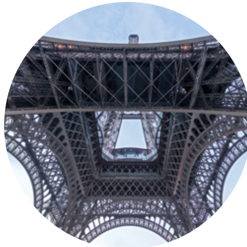
Torre Eiffel París, Francia