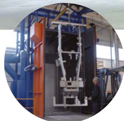
Granallado de piezas de gran volumen y tamaño