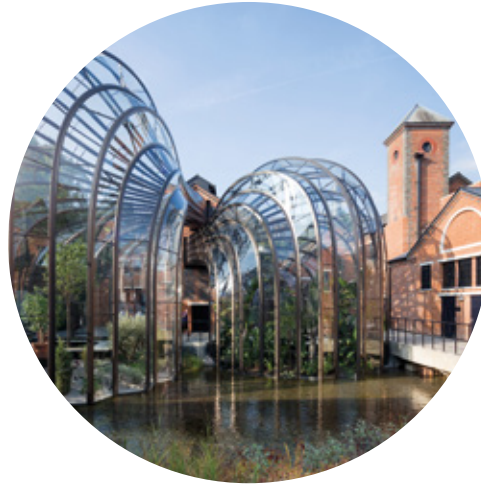
Destilería Bombay Sapphire Londres, Inglaterra

Pintura Industrial Mestres cuenta con las certificaciones europeas de calidad más exigentes y participa en obras emblemáticas y grandes infraestructuras de todo el mundo, exportando todo su conocimiento en el sector de la pintura industrial.