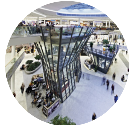
Milaneo Stuttgart, Alemania