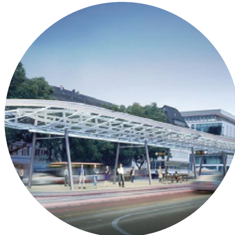
Ostwald Station Krefeld, Alemania