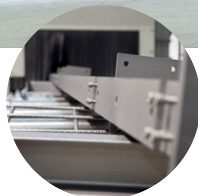
Granallado automático en cadena o continuo