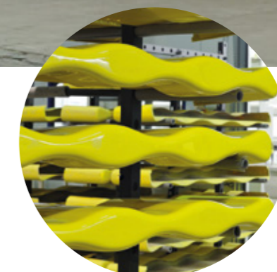
Tratamientos estéticos/cosméticos de alta durabilidad