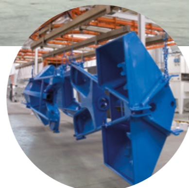
Tratamientos de pintura en polvo para piezas de gran tamaño