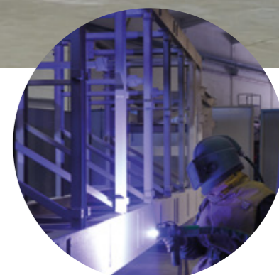
Tratamientos de metalización con zinc