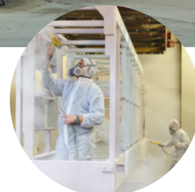
Tratamientos especiales de protección