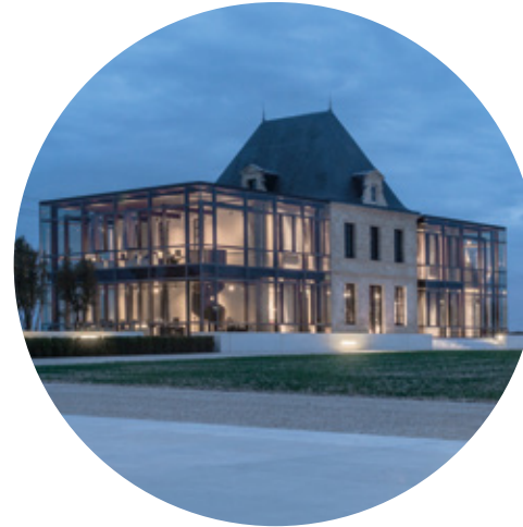
Château Pédesclaux Pauillac, Francia