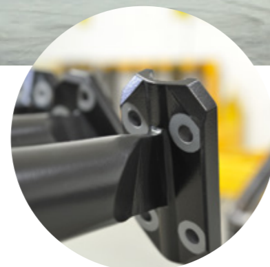
Masillados y preparaciones especiales