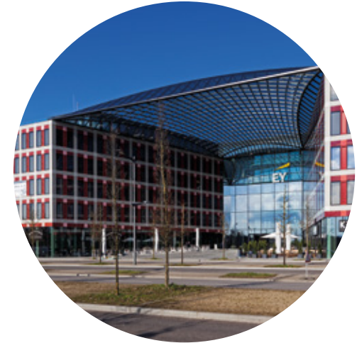
Oficinas Ernst & Young Luxemburgo