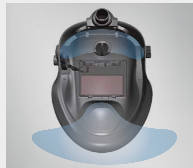
/ Corriente de aire regulable para la zona de la boca y de la frente.