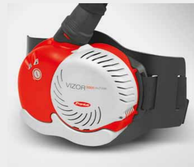
/ El aparato filtrante de ventilador Vizor 3000 AirFilter protege frente a partículas, humo de soldadura y polvo.