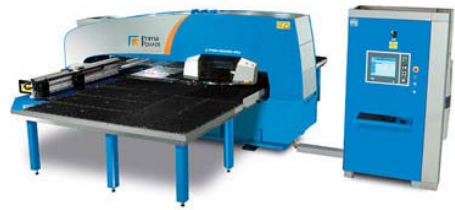
La economía en el punzonado