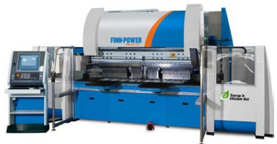
La flexibilidad en el panelado