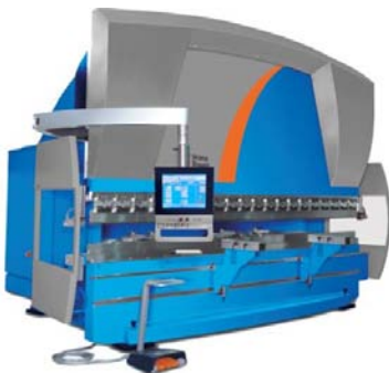
La revolución en el plegado